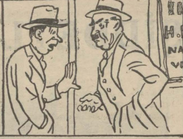
3 — Bugün intihabat karşısında lâkayt duranlar küçükken "sen karışma!," terbiyesi alanlardır.