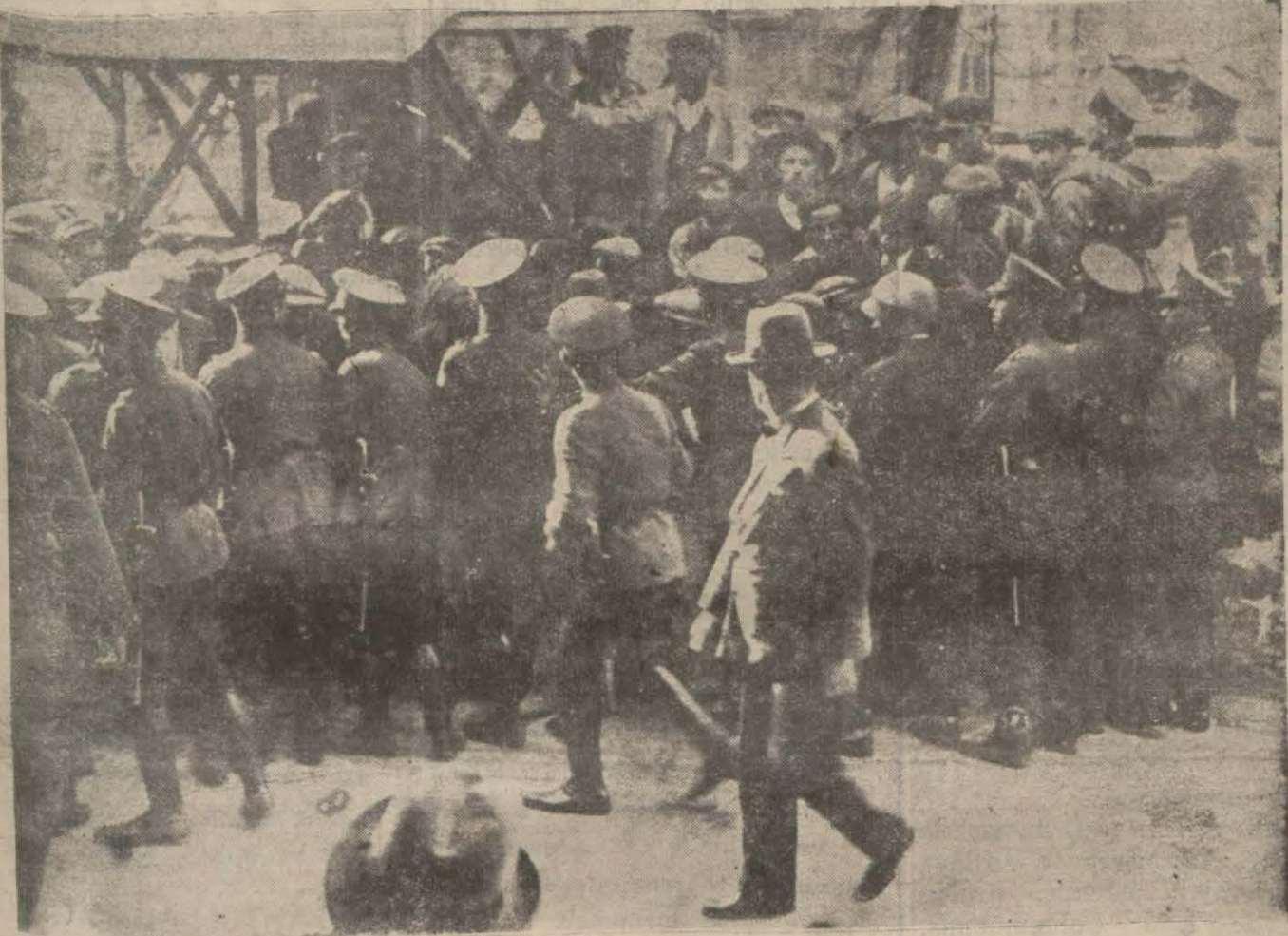
Beyoğlunda, intihaba iştirak etmek isteyen halk polis kordonu önünde

Kadıköy Sandığının Başında Müessesef Bir Vak'a "Üveys,, Atlı Bir Serseri, Merdiven Köy Serbest Fırka Reisini Yaraladı S. F. Yolsuzluklardan Dolayı Vilâyete Protesto Verdi