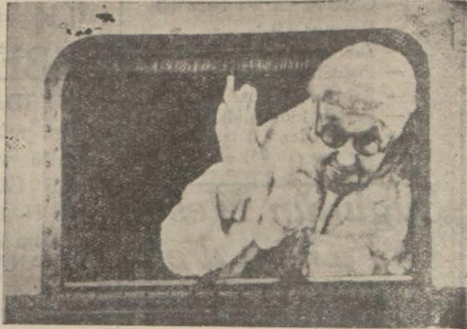
Meşhur teozof kadın balon penceresinden bakıyor

İntihabat ve dahili gürültüler içinde gözden kaçan bu fa-