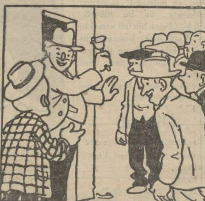
2: Hasan Bey — Oğlum, duhuliyeye kaç? Çıgırtkan — Ne duhuliyesi Hasan B.?