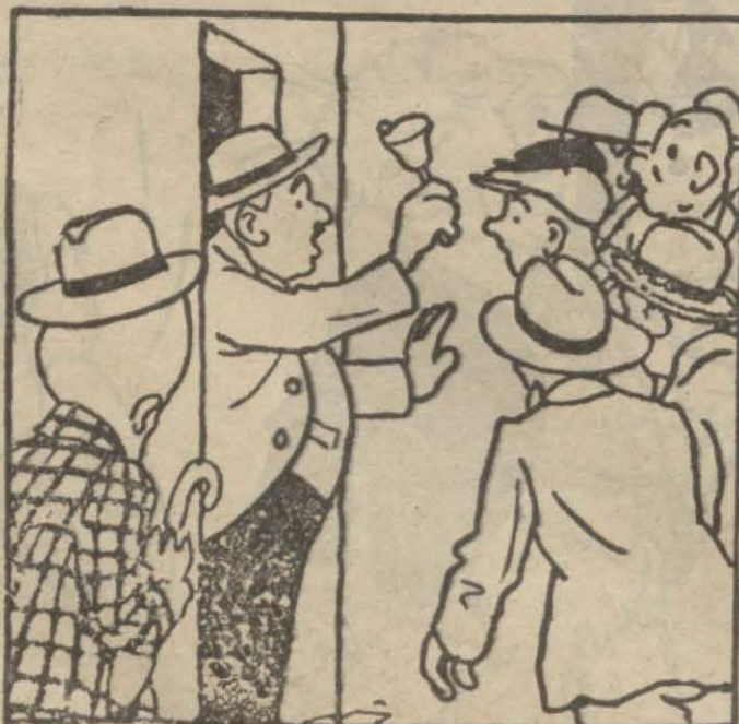
1: Çıgırtkan — Buyurun efendim buyurun... Rey burada veriliyor.. Herkes Halk fırkasına rey versin, vatani biz kurtardık.