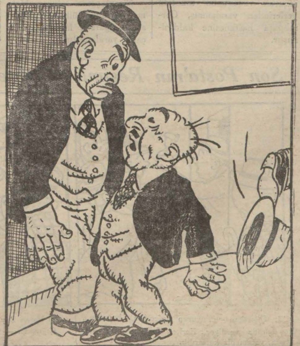
— Serbestçilere rey vermezsen rey vermekte serbestsin!