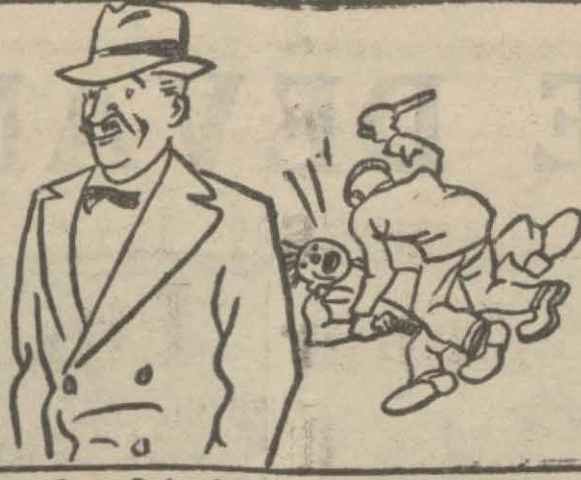
2 — Onlar büyürken hiç birşeye konuşmamak itiyadını alırlar ve en mühim meselelere ehemmiyet vermezler.