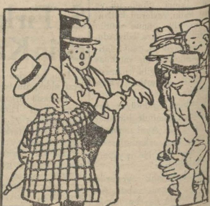
4: Hasan B. — İntihap varsa sen kapının önünden çekil de herkes rahat rahat girsin, reyini versin. Sen kapıda bilet kontrolü müsün?