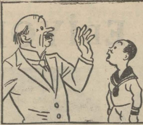
1 — Küçükken çocuklara, fikirlerini söyledikleri vakit: "Sen karışma!," Deriz.